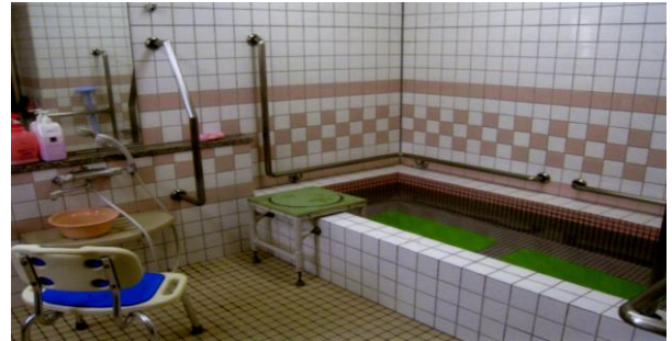
ひとりひとり丁寧に入浴