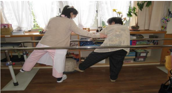
看護師による機能訓練