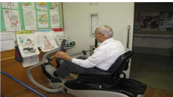
リハ機器 ( 滑車, ニューステップ ) もあり